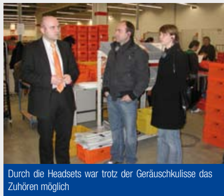
Durch die Headsets war trotz der Geräuschkulisse das Zuhören möglich

Nicht nur der gesamte Abend mit Führung, Diskussionsrunde und Teilnehmerunterlagen, sondern auch der nachfolgende Versand von der Ersttagskarte der neuen Briefmarkenserie „Jakob Fugger“ untermauern: Die LMF wurde zu Recht zum Dienstleistungs-Champion 2008 gewählt!