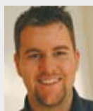
Oliver Ehrenguber Media Alm GmbH

Herausgeber „W.I.N.KOMPAKT“ Wirtschaftsjunioren Augsburg e.V.