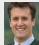
Sebastian B.M. Priller Brauerei S.Riegele